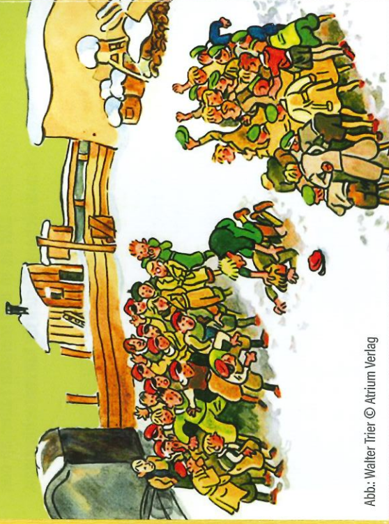
Abb.: Walter Trier

Als der Lieblingslehrer Dr. Johannes Bökh, der als Kind ebenfalls das Kirchberger Internat besucht hat, eines Tages von seinem treuen Freund aus Kindertagen erzählt, den er aus den Augen verloren hat und schmerzlich vermisst, haben die Freunde eine Ahnung, um wen es sich bei Bökhs verschollenem Freund handeln könnte. Sie schmieden einen Plan, um die beiden wieder zusammen zu bringen. Spieldauer: ca. 70 min (zuzüglich 20-30 min Pause)